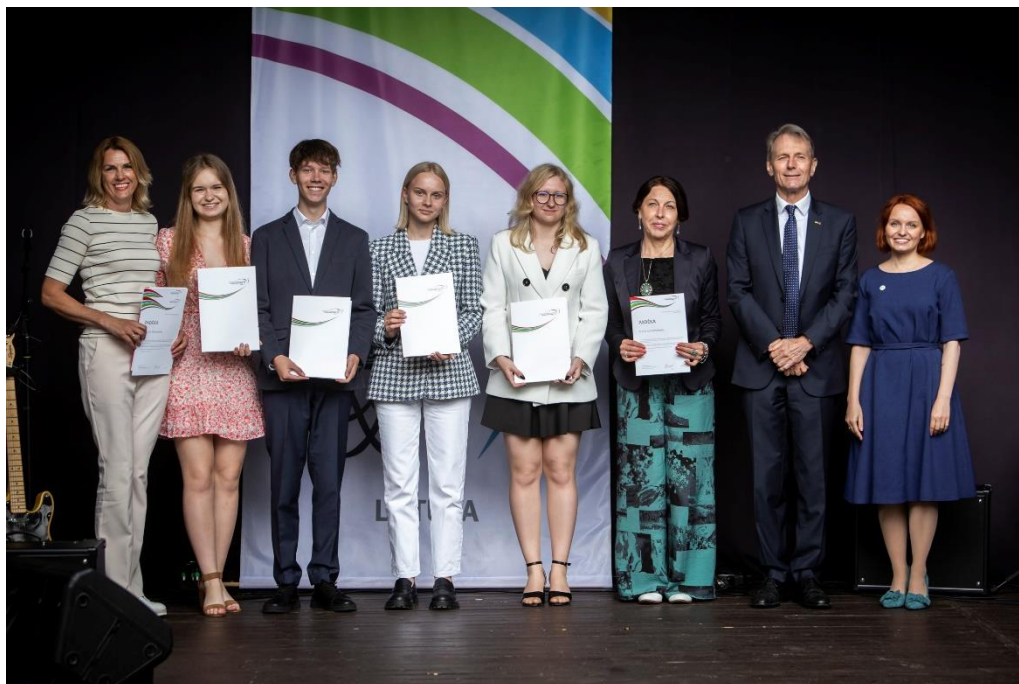
DofE apdovanojimai 2023

Neformaliojo ugdymo programa jaunimui DofE (The Duke of Edinburgh's International Award Lietuva). Gimnazijoje veikia tarptautinė bei išskirtinė ugdymosi programa jauniems žmonėms nuo 14 metų.