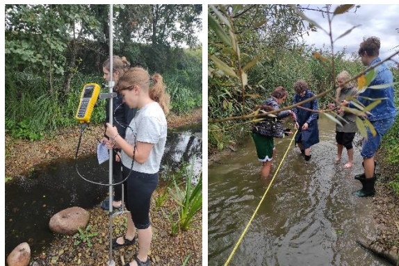
Geografijos praktinis darbas