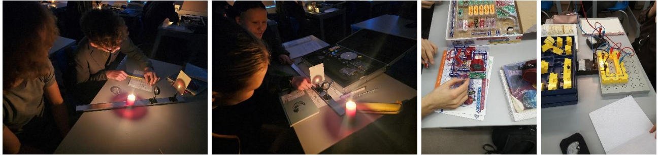
Fizikos laboratoriniai darbai