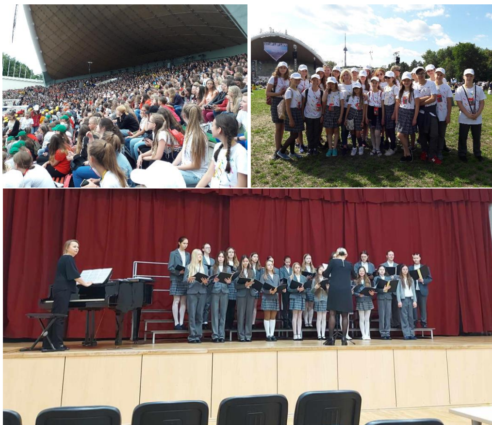
Akimirkos iš Dainų šventės ir jaunių choro repeticijos

Gimnazijos jaunių choras yra nuolatinis respublikinių dainų švenčių dalyvis.