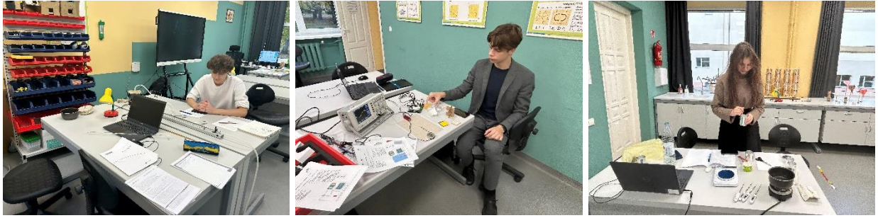
Fizikos darbai Steam laboratorijoje

Diplomo programos mokiniai dalyvavo konferencijoje TEACH EUROPE 2023, kurią organizavo European Schoolnet EUN Partnership AISBL, Briuselis ir diskutavo apie pagrindines Europos Sąjungos vertybes: demokratiją, pilietiškumą, aplinkosaugą ir tvarumą, žmogaus teises, klimato kaitą. Daugiau informacijos rasite čia .