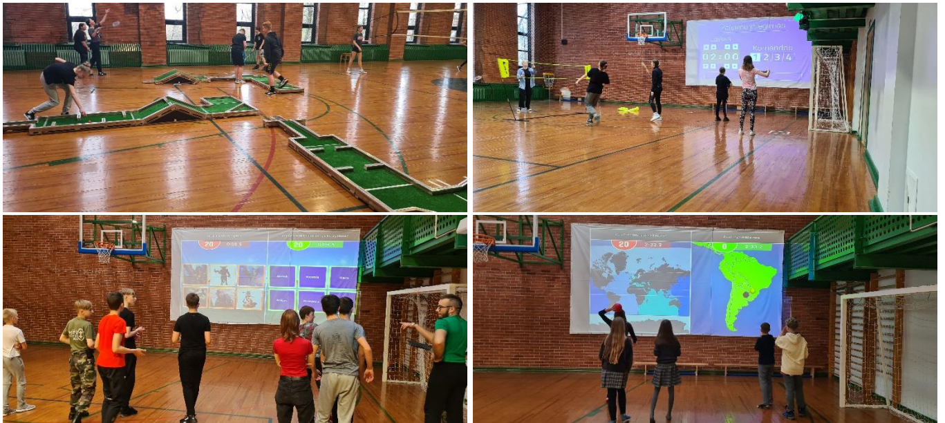
Sporto salėje veikia interaktyvi universali edukacijos ir judesio platforma