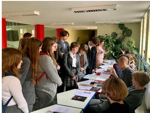
Pažinimo teorijos (TOK) darbų paroda

Tarptautinio bakalaureato diplomo programa (IB DP). Alytaus šv. Benedikto gimnazija – vienintelė švietimo įstaiga Pietų Lietuvoje, įgyvendinanti Tarptautinio bakalaureato diplomo programą. Diplomo programos tikslas – ugdyti nuolat žinių siekiančius, išprususius, nuovokių ir dėmesingus aplinkai jaunuolius, kurie suvoktų ir gerbtų kultūrų skirtumus, padėtų kurti geresnę ir taikesnę pasaulį. Tiek per dalykų pamokas, tiek per kitas veiklas stiprinamas mokinių kritinis mąstymas, kūrybingumas, bendruomeniškumas. Programa akcentuoja praktinį mokymą ir kompetencijų lavinimą, siekiant paruošti mokinius ne tik karjerai, bet ir gyvenimui bendruomenėje.