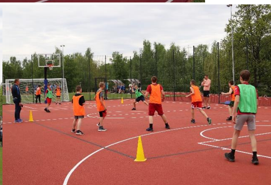
Veiklos moderniame gimnazijos stadione