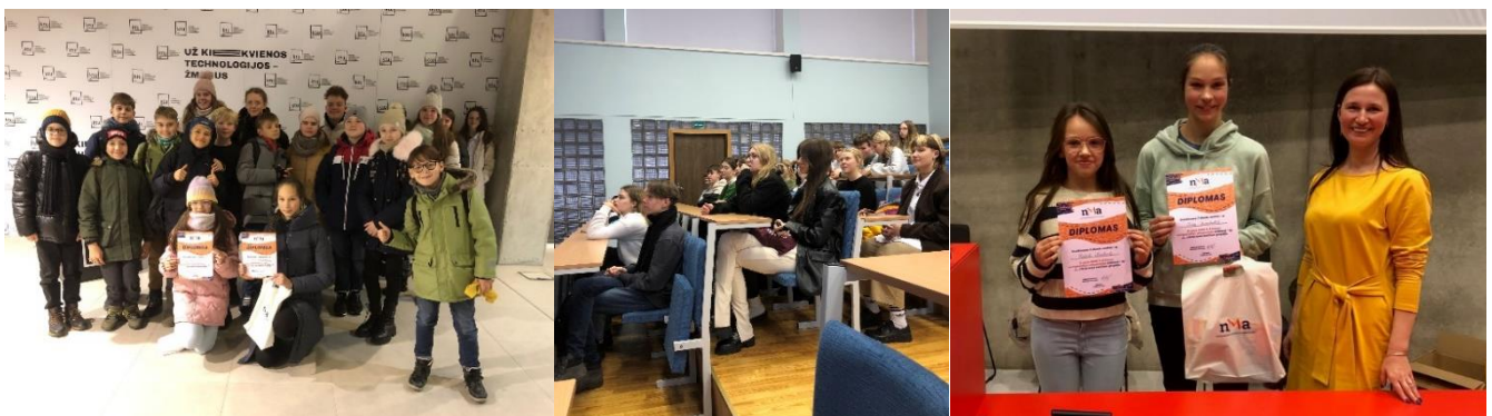
Gimnazijos jaunieji matematikai

Jaunųjų matematikų mokyklos mokiniai dalyvauja Nacionalinės moksleivių akademijos organizuojamoje matematikos olimpiadoje 5–8 klasių mokiniams, Alytaus apskrities komandinėje matematikos olimpiadoje mokytojo Kazio Klimavičiaus taurei laimėti, Alytaus miesto savivaldybės olimpiadose ir laimi prizines vietas.