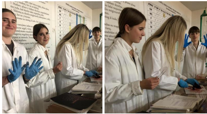
Praktikos darbai biologijos pamokose