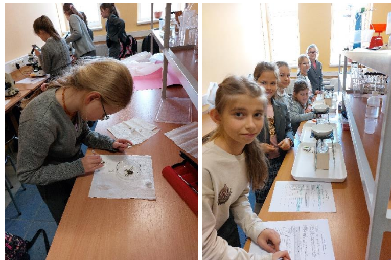
Mažųjų tyrinėjimai gamtos mokslų laboratorijoje

Verslumo klubas. Verslumo klubas aktyviai dalyvauja Lietuvos ekonomikos ir verslumo mokytojų asociacijos veikloje, Junior Achievement Lithuania, taip pat yra Nacionalinio ekonomikos egzamino partneriai, „Išmani Lietuva“ ambasadoriai, „JAMP“ ekonomikos ir verslumo platformos ambasadoriai, Lietuvos „TITAN“ virtualaus verslo čempionato organizavimo ir vykdymo koordinatoriai, aktyvūs LJA ekonominio švietimo ir verslumo ugdymo programų dalyviai, LJA ir Inovacijų agentūros Praktinio moksleivių verslumo ugdymo programos įgyvendinimo Lietuvos mokyklose (9–12 kl.) praktikumo mokykla eksperte.