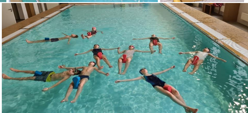
Plaukimo užsiėmimai gimnazijos baseine